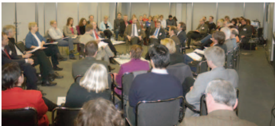
Über 70 Teilnehmer diskutieren intensiv Erfahrungen und Perspektiven der Evaluation ländlicher Entwicklung.